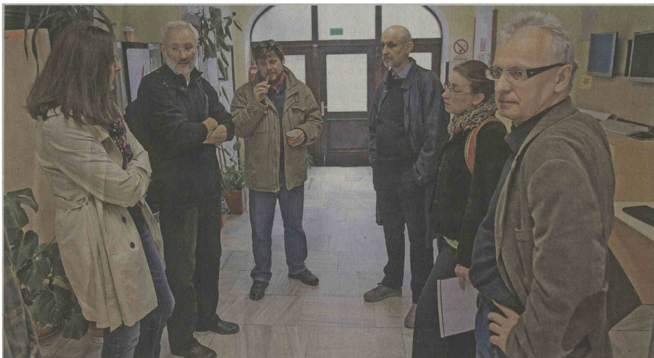
Svobodna univerza, protest proti sedanjemu stanju v visokem šolstvu in poskus odpiranja kritičnega pedagoškega prostora, je v soboto sprejela memorandum.

V memorandumu od vlade in državnega zbora zahtevajo, da zagotovita sredstva za izvedbo programov, prenehata izvajati pritisk na zmanjševanje števila zaposlenih, povečevanje obveznosti ter preprečevanje raziskovalnega in pedagoškega dela, vzpostavita sistem javnega štipendiranja, zagotovita vsaj minimalno plačilo obveznega pripravništva ter to, da mladi doktorji znanosti in podoktorski raziskovalci ne bodo prisiljeni iskati zaposlitve v tujini, izboljšata položaj najslabše plačanih in najbolj prekarne delavcev na univerzi ter odpravita kadrovanje v izvršni oblasti, ki sistemsko povzroča korupcijo v visokem šolstvu.